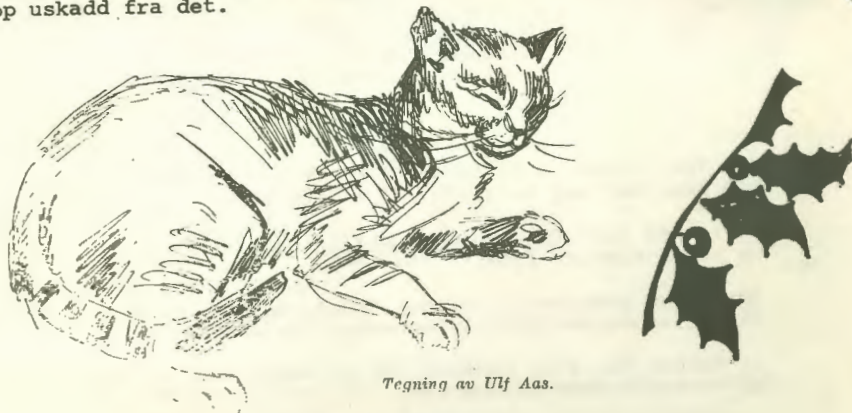
TIL EN VENNINDE

Samspillet med musene gikk over all forventning, og alle parter slapp uskadd fra det.